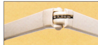
Gelenkarme mit Kette (8000 Bedienzyklen getestet)

Diese Markise mit dazwischen positionierten Edelstahlketten-gelenkarmen ist mit einem verzinkten und pulverbeschichteten 40er Montagerohr ausgestattet. EUROPE 2060 zeichnet sich durch sein neues stranggepreßtes feststehendes Armlager aus, welches eine Neigungs-verstellung von 0° - 60° gewährleitet.