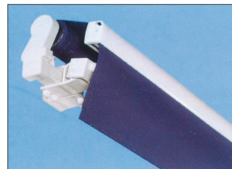
Ansicht der geschlossenen Markise

Um die Gelenkarmmarkise EUROPE 2060 für große Abmessungen auszuweiten, wurde die Markise mit 40er Montagerohr, stranggepreßten Armlagern und Rollenstützlager entwickelt. Ein innovatives Produkt, das sich durch große Ausgereiftheit und eine Vielzahl an Optionen auszeichnet. Besonders zu erwähnen der Vario Volant, Ausfall bis 400 cm und gesonderte Neigungsverstellung der Arme (Duomatic). Diese Markise besitzt eine Regenablaufrinne im Ausfallprofil.